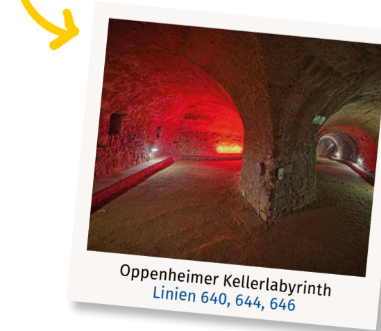
Oppenheimer Kellerlabyrinth Linien 640, 644, 646

Kannst Du ein Ausflugsziel in der Region empfehlen, das gut mit dem ÖPNV erreichbar ist? Das Kellerlabyrinth in Oppenheim kann ich sehr empfehlen, das mit den Linien 640, 644 und 646 gut zu erreichen ist. Dort war ich schon oft mit meinen Kindern.